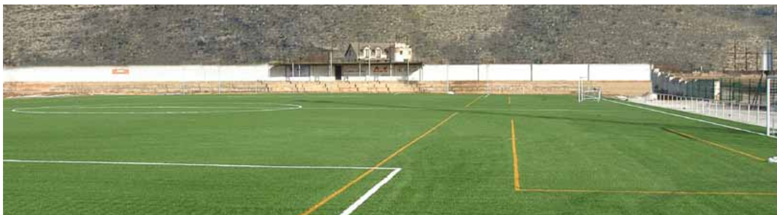
Detalle del césped artificial instalado en el campo de fútbol municipal.