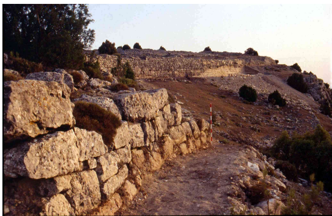
Yacimiento Íbero El Molón